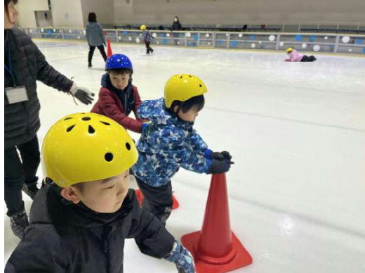
1月23日（金）1年生 氷上スポーツ体験